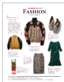
「メナー・ジュセレクト」

ファッション・美容・グルメ・読者スナップなど、読者の気になる内容を、季節に合わせてお届けします。