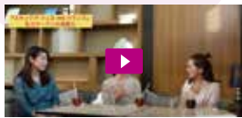
動画 / メナケリオンラインサロン

ユーザーに届けたい「ファッション」「ビューティー&ヘルス」「グルメ」「ニューオープン」「ライフスタイル」「カルチャー」の最新ニュースや、「メナケリオンラインサロン」情報などを、タイムリーに更新!